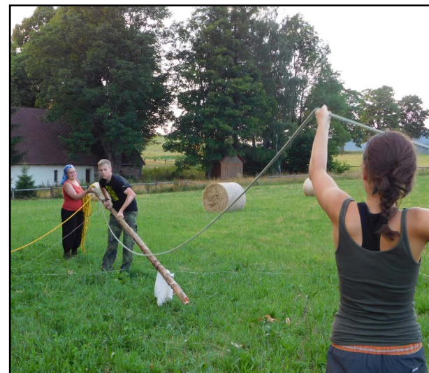
Instruktoři zase vztyčovali vlajku na stožár, který stál uprostřed kruhu, kam nesměli vstoupit