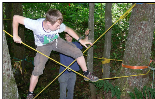
Finská stezka, překážka zvaná X