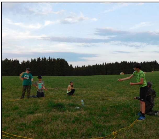
Jedním z úkolů bylo přelit vodu z lahve do ešusu pouze pomocí provázků...