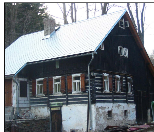
Poznáváte? Takto vypada naše základna před rekonstrukcí...