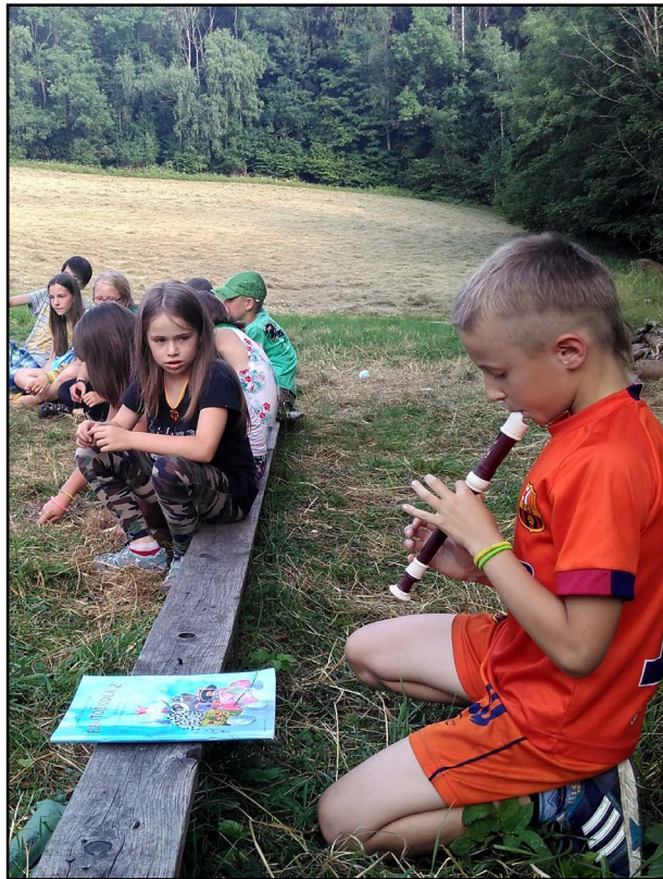
Pajá hraje na flétnu