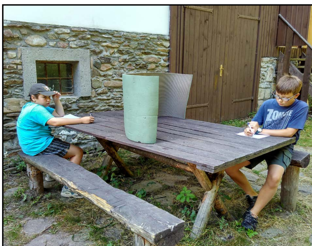
Autor článku píše kroniku o tom, jak po harcu psali kroniky...