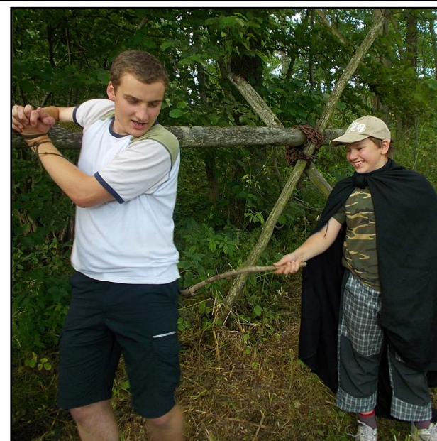
Vedoucí jsou uneseni... a mučeni