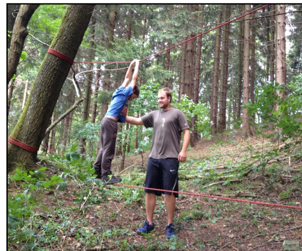
součástí ninja faktoru byla i lanová lávka