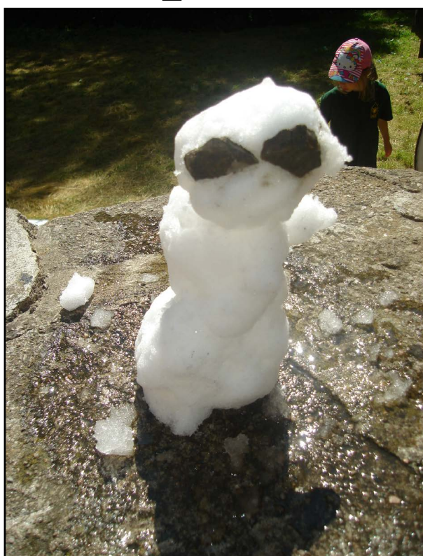
Sněhulák! Kde se tady vzal?

Ostatní si, ale nejsou tak jistí, že sněhulák je výtvozem nebožky ledové královny. „Jadis je mrtvá, to ví každý. Když to spojíme s nedáv-