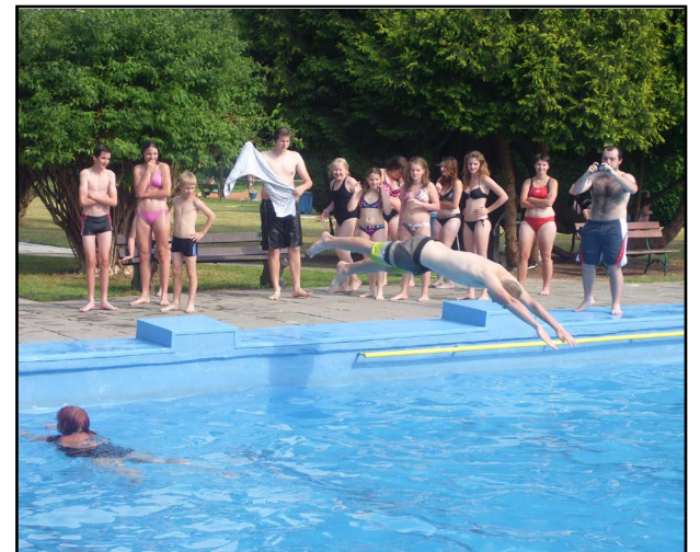
Na koupáku byla legrace...

Naše nepravidelná rubrika KONSPIRAČNÍ TEORIE / ASLANOVY PLKY