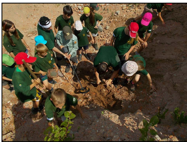
Hledáme meč země detektorem kovu