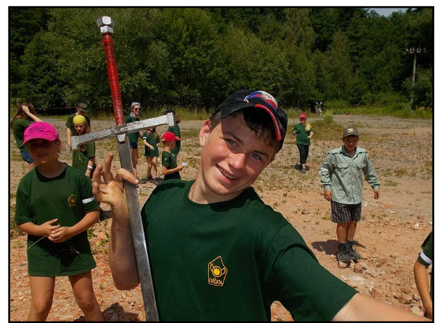
Někteří měli z nálezu meče velkou radost