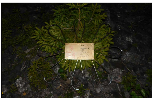
Opravdu existují! Tuto fotku UFO nám už nikdo nevyvrátí...

Ráno jsme se probudili po nočních útocích a hned po snídani se zase něco dělo. Včera při čištění Zdobnice jsme našli mrtvé tělo a u něj