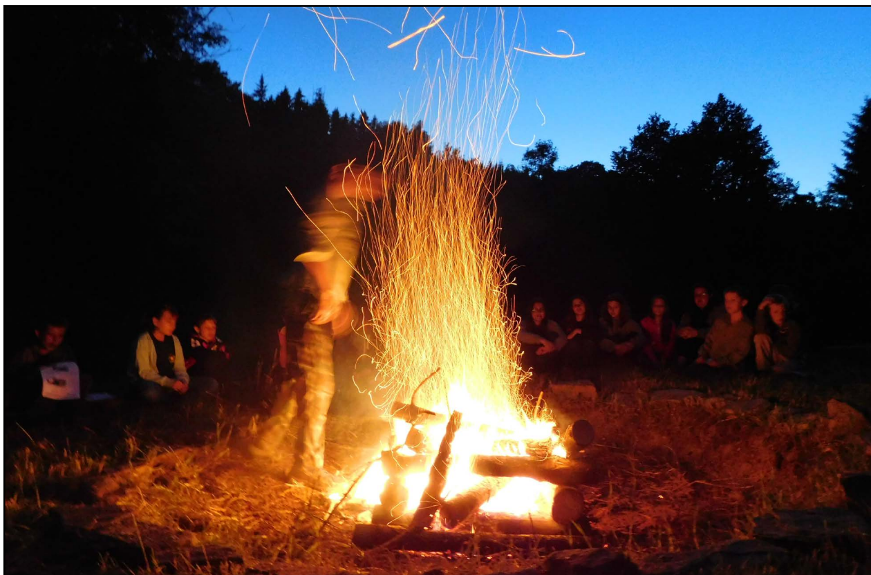
Zahajovací oheň se vydařil