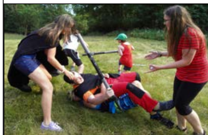
Boj s Telmaríny