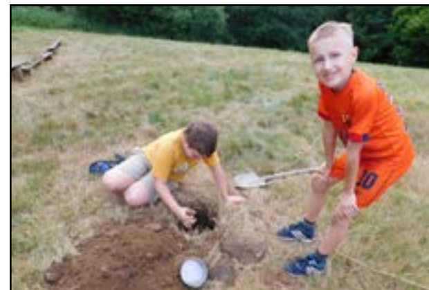
Že by nová nora pro pana Jezevce?