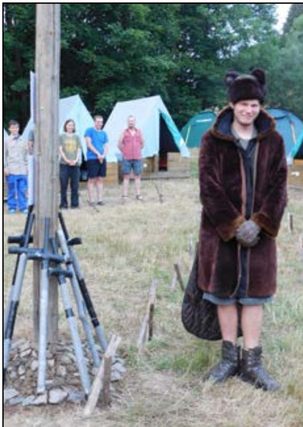
Pan Bobr vede povstání

Pokračovali jsme v dostavbách a najednou k nám přiběhl pan Bobr a poradil jak ukončit Mirazovu vládu. Řekl nám, že při nástupu až přijde „král“ Miraz i se svými čtyřmi Telmaríny. Naše práce se mu vůbec nelíbila, tak ze samého vzteku kopl do plůtků a tím nás velice