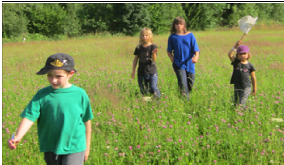
Vítězný marš Rychlé roty