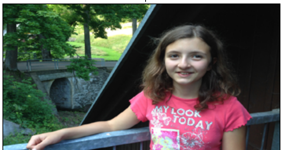
Respondentka při schůzce na utajeném místě