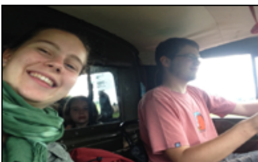
Vedoucí dne a vrchní hlídač na výletě, v táboře mezitím probíhají kohoutí zápasy

Jak vedoucí dne tak i vedoucí hlídek se vrátili zpět v pozdních odpoledních hodinách. Jeden ze svědků události, který si nepřeje být jmenován, komentoval událost takto: "Měli jsme ke svačině rohlík a mléko. Později bylo i na přidání."