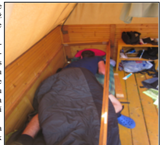
Kdo mu přišel popřát dobré ráno, musel tentokrát pořádně sklonit hlavu

Alarmující je ale hlavně to, že se problémem padajících postelí zatím nikdo důkladně nezabýval. Vláda už slíbila, že se v nejbližší době projedná vyhlášku o minimální nosnosti postelí na letních táborech. „Jestli spadne ještě jedna postel, tak začnou padat hlavy.“ nechal se slyšet ministr zdravotnictví.